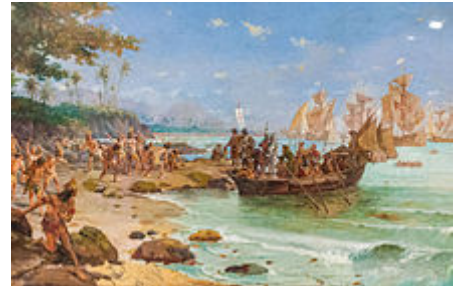
L'arrivée de Pedro Álvares Cabral à Porto Seguro en 1500 par Oscar Pereira da Silva (1865–1939)

Le 22 avril (2 mai, grégorien), accident de parcours ou mission secrète d'officialiser une prise de possession, on voit « terra chã, com grandes arvoredos: ao monte » (une terre avec grande arborisation : un mont). Cette colline fut baptisée par Cabral de Monte Pascoal , et la terre, Terra da Vera Cruz (Terre de la Vraie Croix). C'est aujourd'hui Porto Seguro , dans l'État de Bahia .