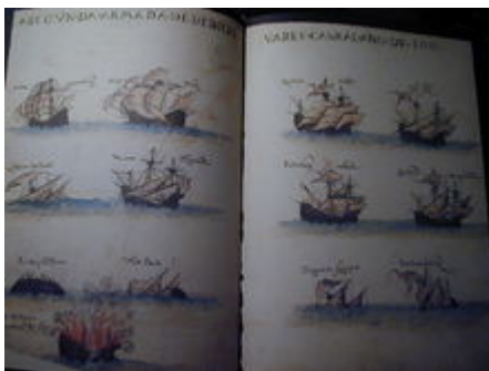
Armada de Pedro Alvares Cabral.