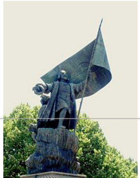
Monument dédié à Pedro Álvares Cabral. Lisbonne

Ce document provient de « https://fr.wikipedia.org/w/index.php?title=Découverte_du_Brésil&oldid=141615655 ».