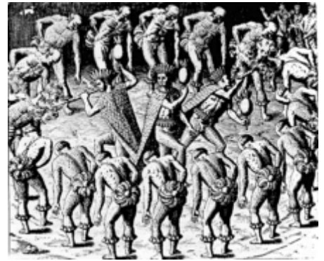
Les Tupinamba dans l'ouvrage de Hans Staden au xvi e siècle

En 2000 ont été commémorés les 500 ans de la découverte du Brésil, ce qui provoqua beaucoup de discussions. Pour beaucoup, cette commémoration suppose que l'histoire du Brésil a cinq cents ans en 2000 dans une optique clairement eurocentrique, vu que cela suppose que le processus historique ne commence, dans les terres qui forment aujourd'hui le Brésil, qu'avec l'arrivée de la flotte de Cabral. Mais ce qui pouvait également être commémoré, c'est le fait que les habitants du territoire allaient bientôt commencer à souffrir, avec le développement de l' esclavage et les guerres d'extermination qu'entreprirent les nouveaux venus, sans omettre les maladies infectieuses apportées par les Européens, ou le processus d'assimilation, qui amenèrent la disparition de la plus grande partie des tribus amérindiennes aborigènes.